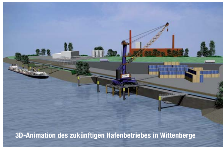
3D-Animation des zukünftigen Hafenbetriebes in Wittenberge