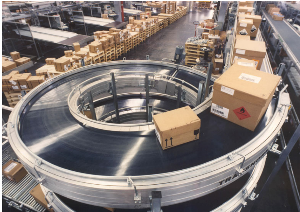
Wendelförderer des Distributionszentrums